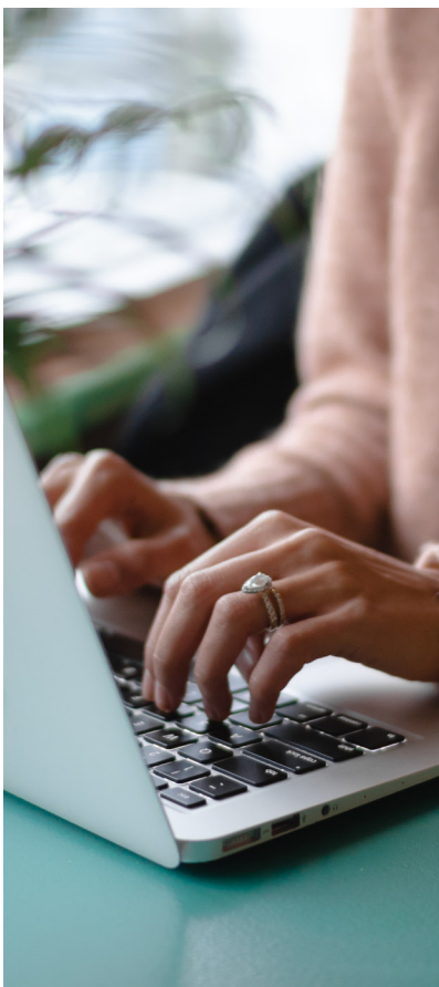
IMAGEM E REPUTAÇÃO

O colaborador e/ou fornecedor é responsável por tratar de forma confidencial as informações sobre a propriedade intelectual a que tenha acesso em decorrência de seu trabalho, utilizando-as de forma cuidadosa. Não é permitida a divulgação dessas informações sem a autorização expressa de representantes da Sinqia